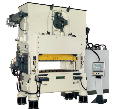
Die BRUDERER Stanzautomaten gelten in der Blechstanz- und Umformindustrie als Synonym für maximale Leistung, höchste Präzision und unübertroffene Zuverlässigkeit.